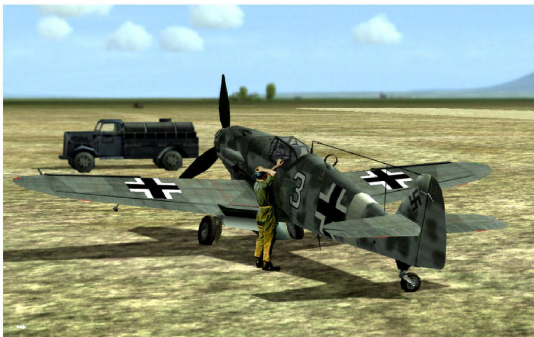
Le plein terminé, les dernières instructions de l'Ofhr. À un Lansquenet fraîchement débarqué en Italie.