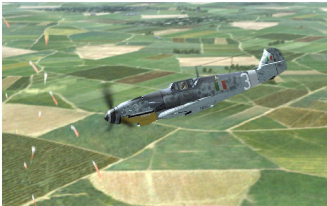
LQT-Sebtje, 356 Squadriglia en mission de reconnaissance vers Anzio, la première semaine de bataille.